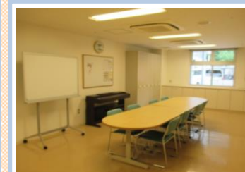
【ボランティアルーム】

12名程までのご利用がおススメのお部屋です。楽器や絵の練習、打ち合わせなどでのご利用があります。